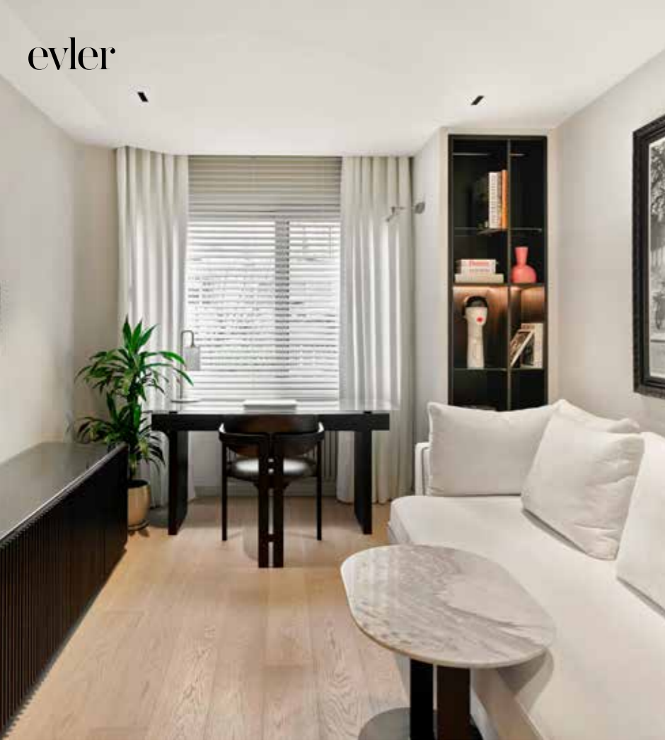
Bu mekân ev sahiplerinin hem ofis, hem sinema odası, hem de konsol oyunları için bir alan olarak kurgulandı. Çalışma odasına Burhan Doğançay'a ait bir fotoğraf konmuş.